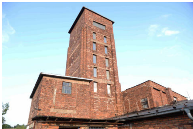
Rudá věž smrti

V souvislosti s rozhodnutím UNESCO ze 6.7.2019 rozprostit ochranná křídla nad historicky významnou a událostmi přesycenou hornickou krajinou Krušnohoří, se nabízí: putování po naučné stezce „Jáchymovské peklo“ dlouhé 8,5 km, prohlídka muzea v Jáchymově se sbírkou minerálů a hlavně s výstavou „3. odboj“ v 1.poschodí, také návštěva Štoly 1 a dosud jen s povolením také „Rudou věž smrti“ 1 u Vykmanova -jedna z částí obce Ostrov, kde se dříve