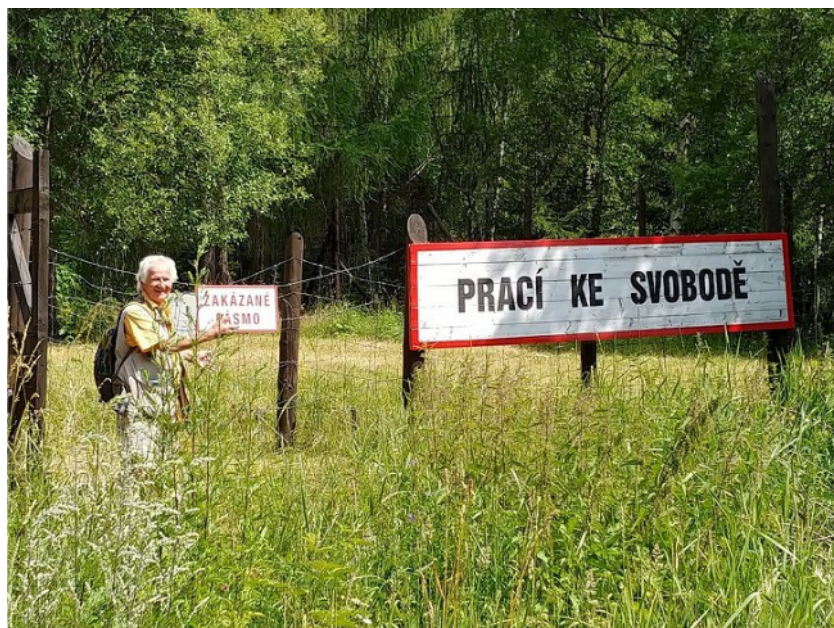
Prací ke svobodě

Štola1 se nachází 5 minut od „Penzionu u štoly“ a je pro zájemce otevřena od 10 do 16 hod. Paní průvodkyně Zuzana je znalá, začíná vždy v celou hodinu a vezme maximálně 25 lidí včetně dětí. Dobrá obuv a teplá bunda jsou vhodné. Prohlídka ukazuje podmínky, ve kterých „političtí“ vězni, tzv. muklové dennodenně pracovali, často museli i přes čas, aby splnili normu. Heslo vévodící nacistickým koncentrákům „Arbeit macht frei“ vyvěsili komunisté pouhé čtyři roky po skončení války nad vstup, vjezdem do lágrů a znělo: